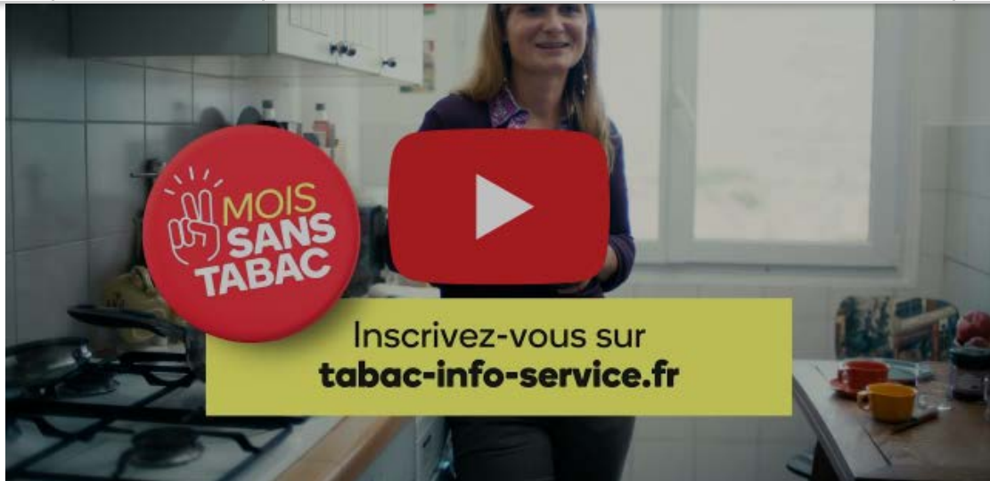
Mois sans tabac 2021 : les anciens fumeurs témoignent – Marie

Ne pas toucher une cigarette pendant un mois entier, c'est le défi que pose pour la 6ème année consécutive l'opération "mois sans tabac".